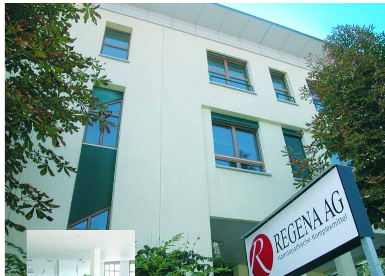
Die neuen Räumlichkeiten im Hauptsitz der REGENA AG in Ebikon.

Ich wünsche mir ein grösseres Interesse der Wissenschaft an der Erforschung der Wirkmechanismen, die der Homöopathie zu Grunde liegen.