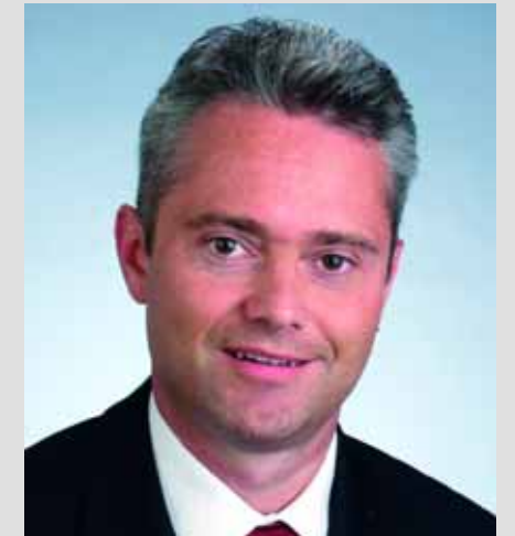
Liebe Leserin, Lieber Leser

Die Bürli Generalunternehmung AG hat sich nach bekanntwerden der ersten Einsprachen dieser Problematik angenommen. Die bereits verfahrenre Situation wurde durch zahlreiche Gespräche und Besichtigungen vor Ort mit beiden Parteien schliesslich einvernehmlich geklärt. Mit dem Spatenstich konnte am 16. Juni 2003 mit dem Bau der neuen Werkhalle begonnen werden konnte.